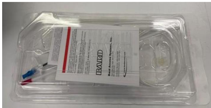
Imagen 1: Bandeja exterior del producto terminado

BD ha identificado, mediante inspecciones internas, que el embalaje de algunos kits de catéter Hickman™ y Broviac™ puede tener daños en la bandeja exterior, lo que podría comprometer la barrera estéril. Este producto presenta una estructura de empaquetado de doble bandeja (bandeja exterior e interior). La bandeja interior, que contiene el catéter y los accesorios, está sellada dentro de la bandeja exterior junto con las instrucciones de uso. La esterilidad de la superficie exterior de la bandeja interior y las instrucciones de uso pueden verse comprometidas.