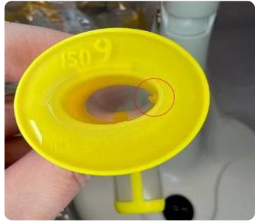
Ejemplo del defecto de fabricación de las Cánulas Guedel.