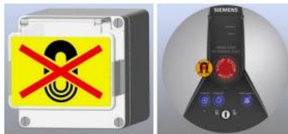
Figura 2. Ejemplos del interruptor de paro del imán.