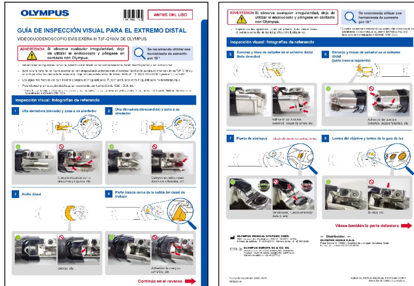
Figura 1: Guía de inspección visual del extremo distal: cara delantera/cara trasera